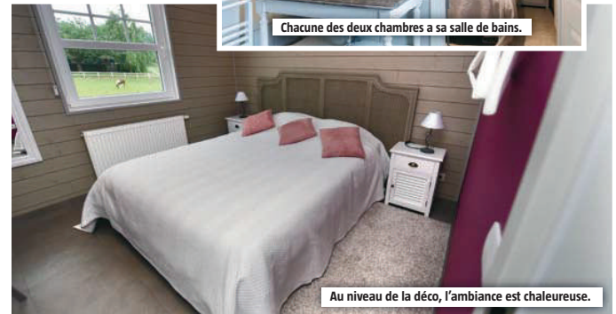
Au niveau de la déco, l'ambiance est chaleureuse.