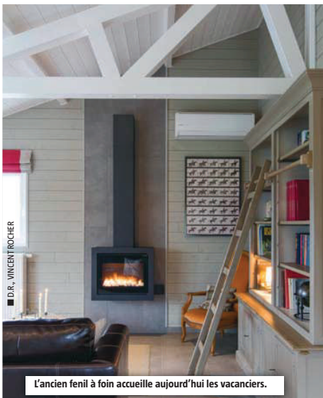
L'ancien fenil à foin accueille aujourd'hui les vacanciers.

À NOTER: RETROUVEZ CETTE MAISON SUR WWW.ARDENNES-ETAPE.BE (RÉFÉRENCE: 106022-01)