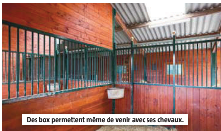
Des box permettent même de venir avec ses chevaux.