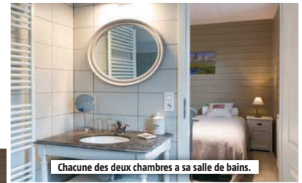
Chacune des deux chambres a sa salle de bains.