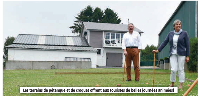
Les terrains de pétanque et de croquet offrent aux touristes de belles journées animées!